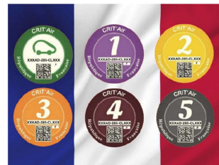
フランス環境ステッカー