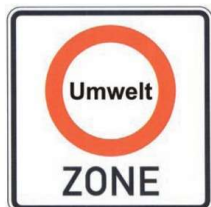
ドイツ環境ゾーン