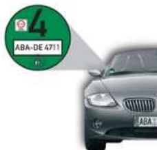
ドイツ環境ステッカー

都市を環境汚染から守るため、欧州の多くの都市で環境基準に合致していない車両の市内乗り入れを制限する傾向にある。これは環境ゾーン（Low Emission Zone=通称 LEZ）という。ほとんどの国がトラックにのみ規制しているのに対し、ドイツやフランスの主要都市では乗用車にも適用される。ドイツの環境ゾーン(UmweltZone)や、フランスの主要都市に乗り入れる際は事前に専用のステッカーを入手し、車両に貼っておく必要がある。国外に出る前には LEZ のウェブサイト ( www.lowemissionzones.eu ) をチェックする。ドイツ・フランスの環境ステッカーの詳細は D's International のウェブサイト( www.dsint.nl/ ) のお客様ページに記載あり。