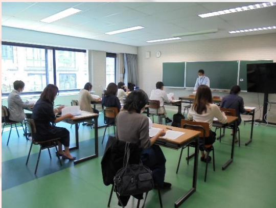
中学部3年生 進路説明会【保護者】