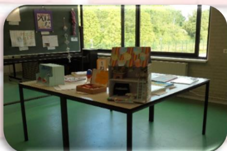
今年も力作がそろって いました!