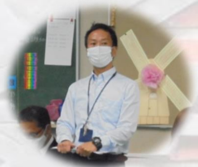
中学部長と3年担任による説明