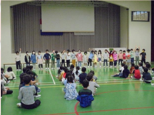
1年生を迎える会 (小学部)

今日は、25日に行われた「中3進路説明会」と小学部の「1年生を迎える会」の様子を紹介します。 また、23日から3日間行われた「夏休み作品展」についても、一部を紹介します。行事のページにも掲載しています。