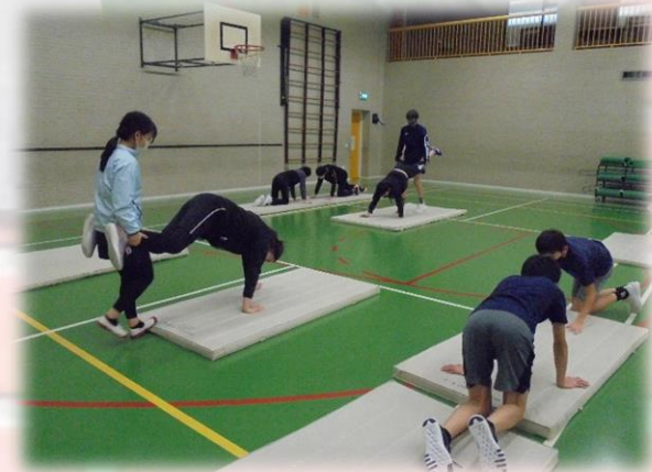
中学部 体育 マット運動 とび箱