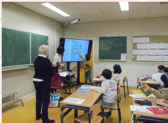
小学部3年生 外国語活動