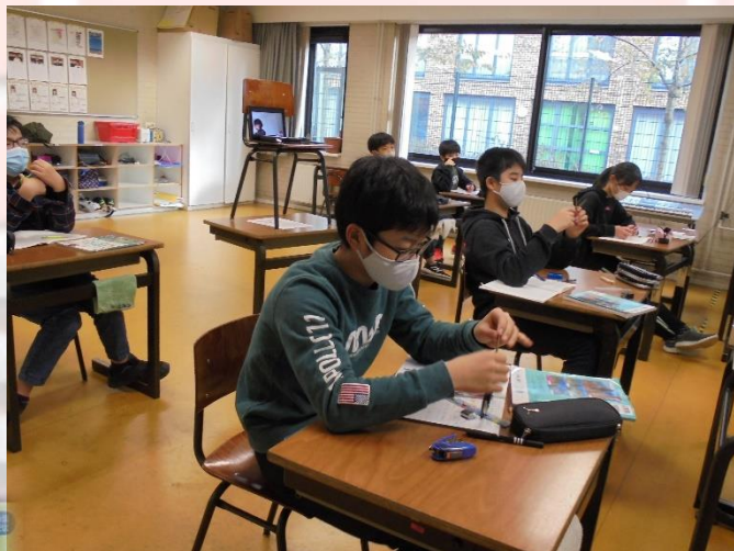
小学部6年生 理科 てこのはたらき