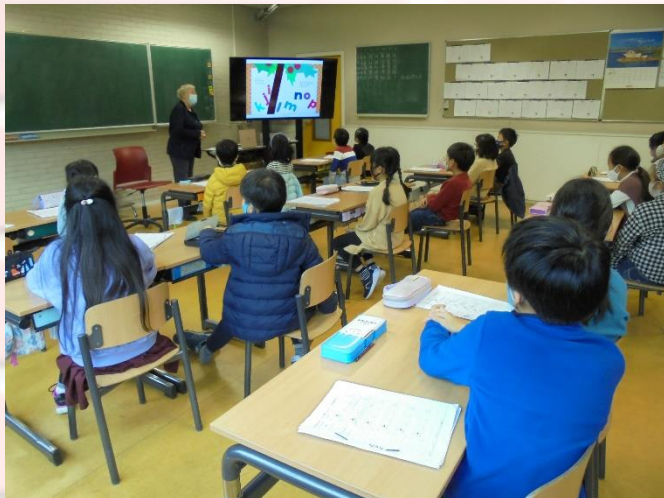
小学部3年生 外国語活動

今日は小学部3年生、6年生と中学部1年生、3年生の学習の様子をお知らせします。具体物を使ってこの原理を考えたり、グループ討議で自分の考えを深めたりする学習が行われていました。