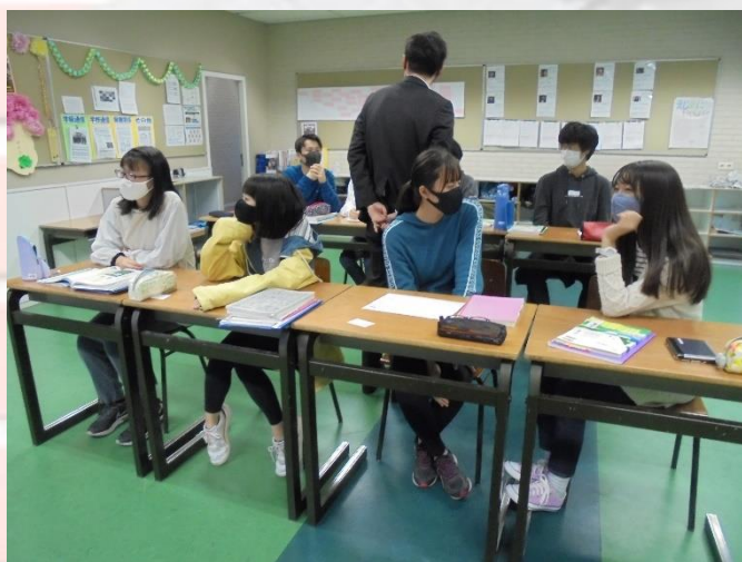
中学部3年生 国語 グループで討議