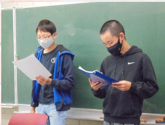
中学部1年生 EL ポーリン先生クラス